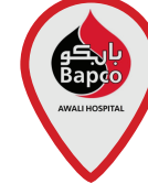
Awali Hospital (Awali)