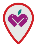
Middle East Hospital (Alhidd & Manama)