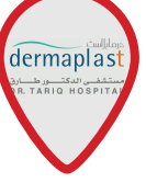
Dr. Tariq Hospital (Umm Al Hassam)