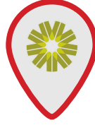
KIMS Bahrain Medical Centre (Muharraq)